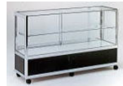
ディスプレイケース